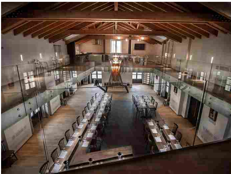
Montalbera. Sala degustazione