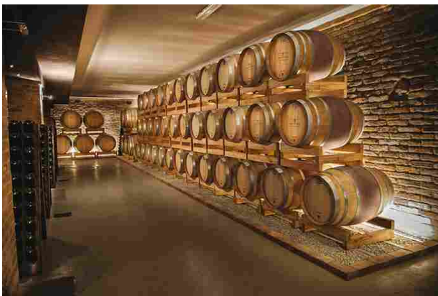
Montalbera. La cantina

Montalbera ha intrapreso un ulteriore percorso innovativo, focalizzato sull' utilizzo delle anfore in terracotta per la maturazione dei suoi vini . Questa ricerca approfondita ha portato ad una rinnovata valorizzazione delle varietà autoctone della zona, in particolare il Ruchè e il Grignolino d'Asti .